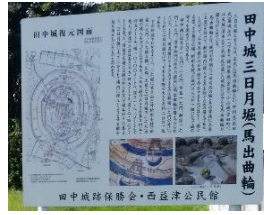
『田中城三日月堀』 (馬出曲橋)